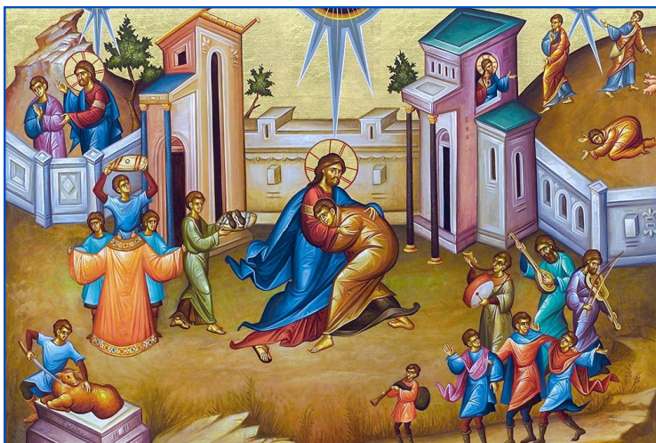
Sunday of the Prodigal Son Неділя Блудного Сина

Христос Родиться! Славте Його! Christ is Born! Let us Glorify Him!